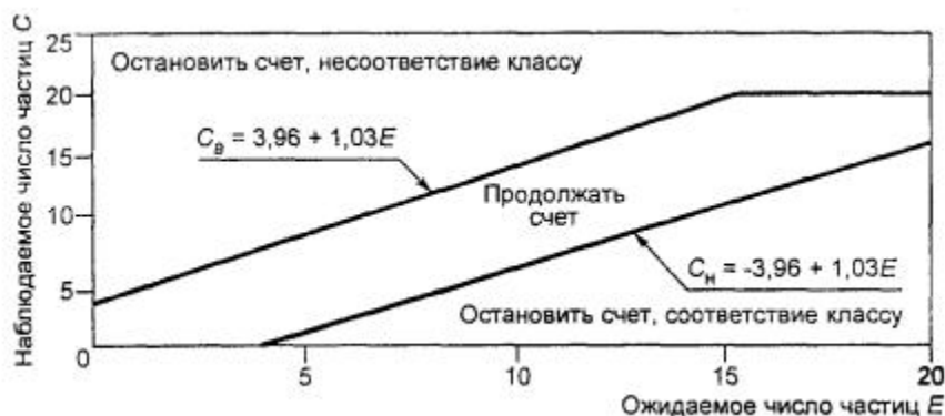
Рисунок F.1 - Границы соответствия и несоответствия классам чистоты при использовании метода последовательного отбора проб

Для сравнения наблюдаемого числа частиц C и ожидаемого числа частиц E могут использоваться графический (рисунок F.1 ) или табличный методы (таблица F.1 ).